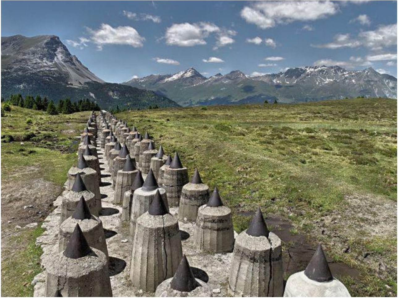
Altra linea anticarro (i “denti di drago”)